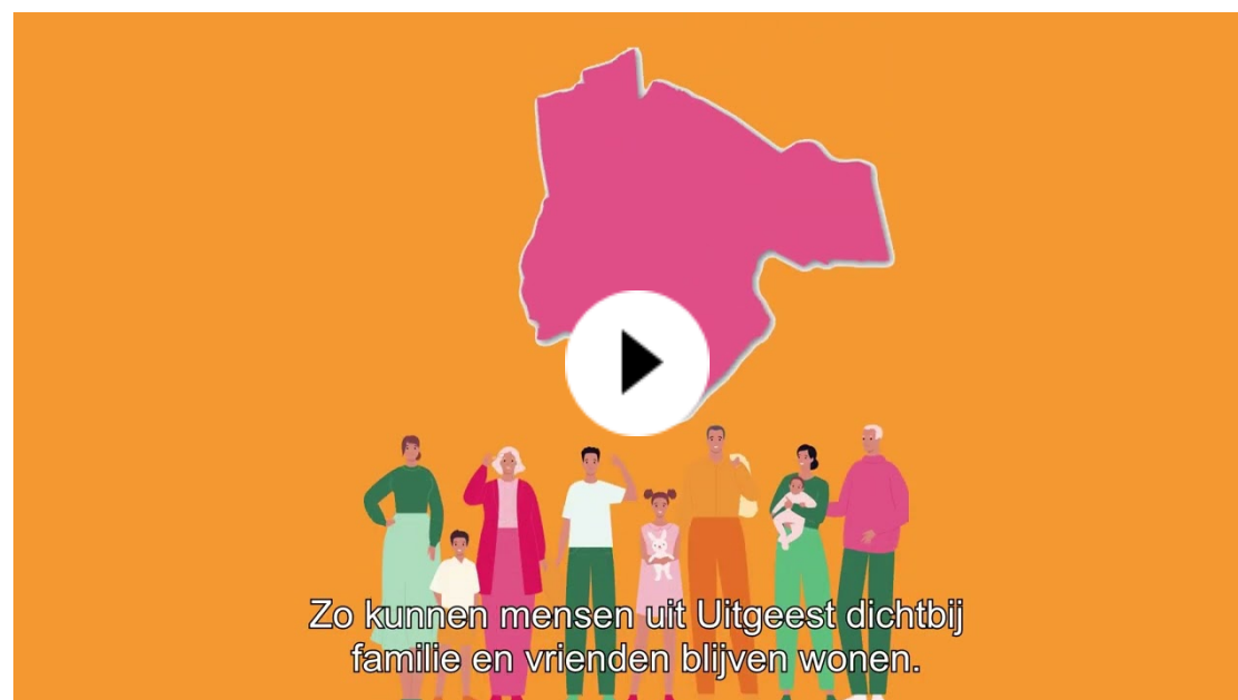
Bekijk het wat, waarom en hoe van het plan in een video van 100 seconden.

De nieuwbouw van Geesterheem... Waarom is dat ook alweer nodig? En hoe ziet het plan er op hoofdlijnen uit? We kunnen ons voorstellen dat u dat even niet meer helemaal scherp heeft. We vertellen het in een korte, krachtige video, die u zo vaak als u wilt, kunt bekijken.