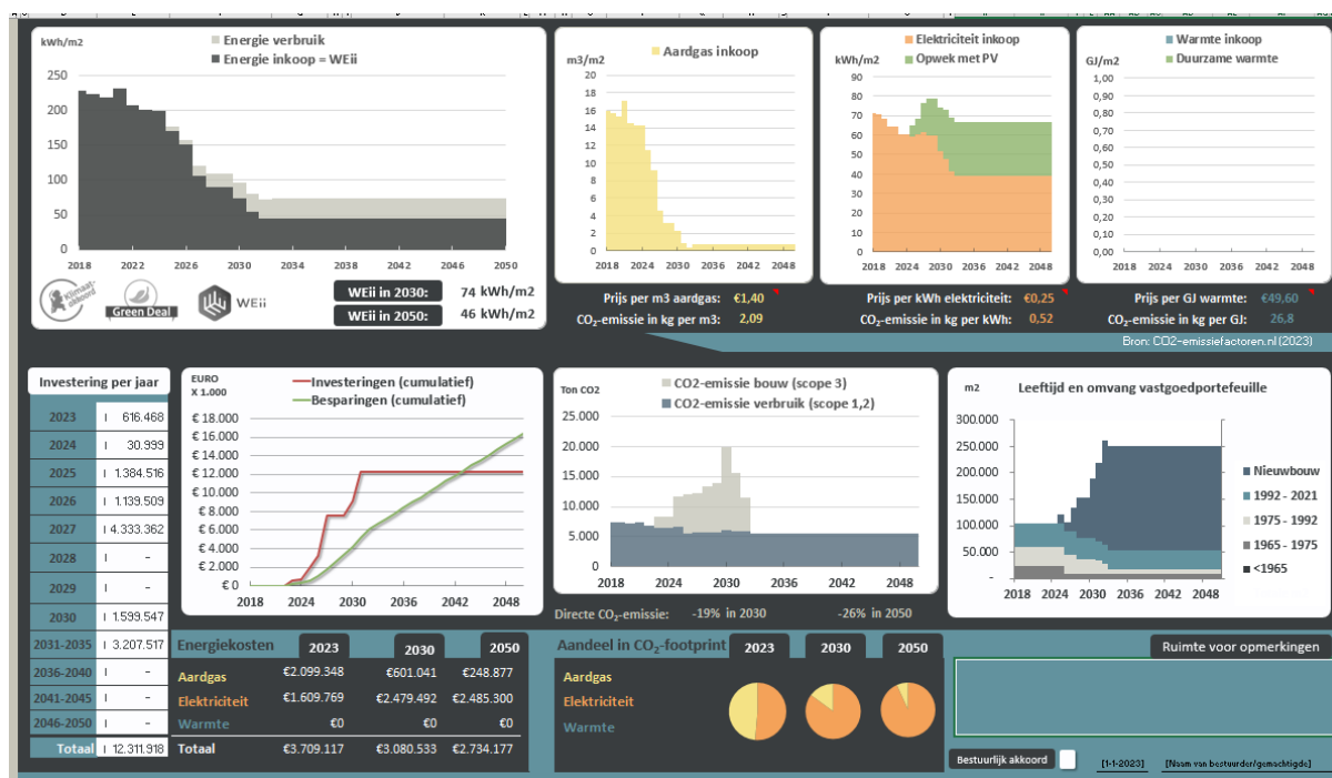
Figuur 1: Dashboard met daarin het duurzaamheidsoverzicht.

■ CO 2 Routekaart: ViVa! Zorggroep heeft in 2023 de nieuwe versie van de CO 2 routekaart ingevuld, waarin de Erkende Maatregelen 2023-2025 nog verwerkt worden. Een CO 2 -routekaart laat zien op welke manier een organisatie wil werken aan de klimaatdoelen. De routekaart geeft per gebouw inzicht in de geplande energemaatregelen, de verwachte besparing (energie en kosten) en de benodigde investeringen. Zo kunnen we zien of ViVa! Zorggroep aan de wettelijke verplichting uit het klimaatakkoord kan voldoen. De CO 2 -routekaart, stand van zaken op 31 december 2023, laat zien dat Viva! Zorggroep op weg is om het gestelde doel van 55% reductie in 2030 te halen.