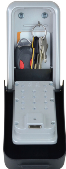
Sleutels in sleutelkluis